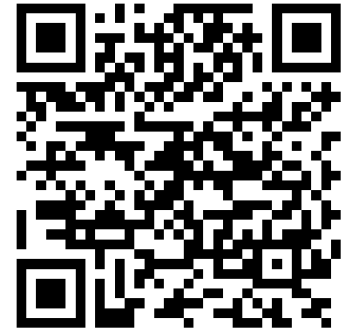
EUREGA Track im Play Store